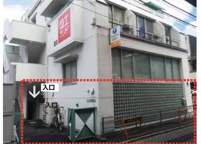
●ガラスブロックの半地下部分※駐輪場はございません