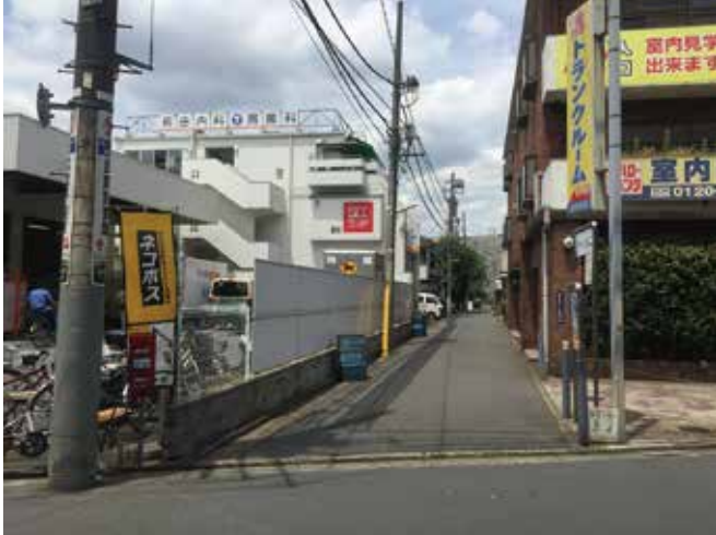
●ヤマト運輸、トランクルーム間の路地, 前田内科さん下