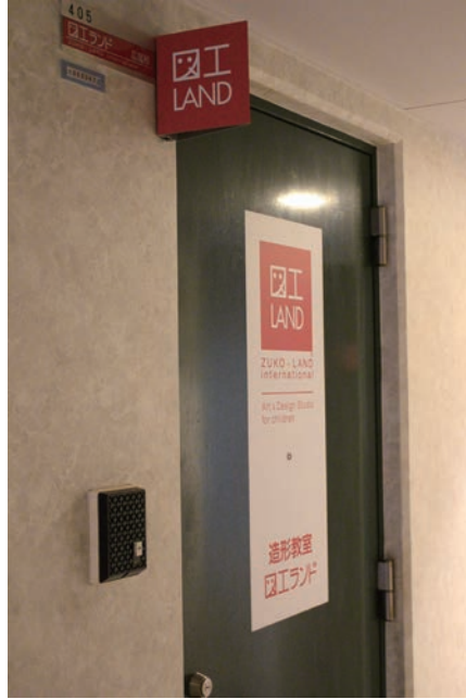
405号室 Room 405