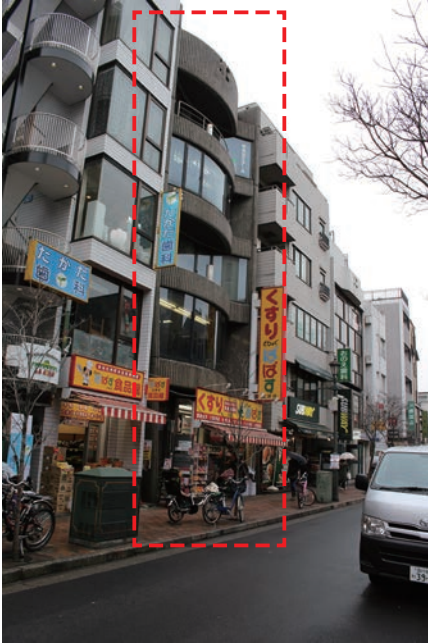
1Fはくすりのばぱす 1F Drugstore

TEL03-5422-9200 (直通 Eng.) 03-3491-1736 (代表)